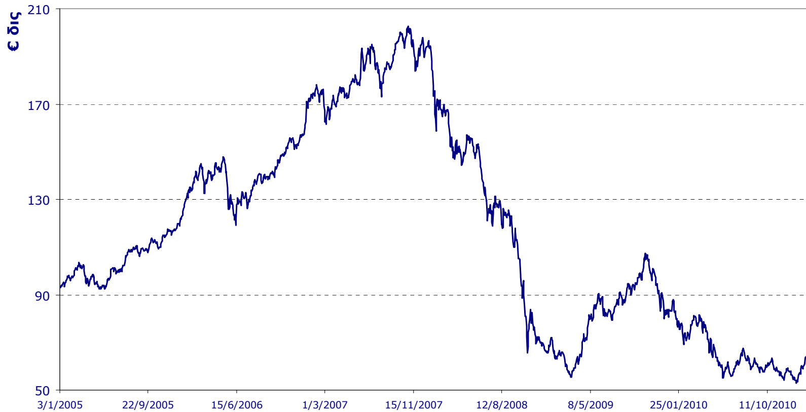
Κεφαλαιοποίηση Αγοράς Μετοχών ΧΑ